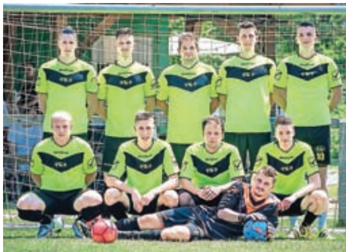
Skupinska slika ekipe Gostišče ob Planšarskem jezeru Jezersko

Letos smo se jezerski nogometaši spet združili in se z imenom Gostišče ob Planšarskem jezeru Jezersko udeležili prvenstva občine Preddvor. V skupinskem delu tekmovanja smo se brez težav prebili do polfinala, tu pa smo izgubili proti kasnejšim prvakom Cvetličarni Urška. Za tretje mesto je sledilo izvajanje kazenskih strelav proti ekipi Preddvor mladi, ko so imeli več športne sreče nasprotniki. Osvojili smo končno četrto mesto, s katerim smo bili zelo zadovoljni. Seveda pa je bilo za nas, igralce, bolj kot rezultat pomembno ekipno sodelovanje, ki je bilo prežeto z borbenostjo, dobro voljo in smehom. Za udeleževanje jezerskih nogometašev na turnirjih pa nam očitno tudi v prihodnosti ni treba skrbeti. Kar 10–15 otrok se udeležuje treningov nogometa, ki potekajo na Jezerskem. Zaradi neprimernosti treniranja na asfaltni podlagi se je pojavi-