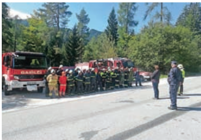
Na skupni gasilski vaji v Solčavi

Tako kot že vse od leta 1988 dalje smo se gasilci zbrali na skupni vaji, letos na Solčavskem na kmetiji Covnik. Poleg domačega gasilskega društva PGD Solčava smo sodelovali še PGD Jezersko in FF Bad Eisenkappel, gasilcev z Rebrce pa letos žal ni bilo na vaji. Zjutraj smo se zbrali na Pavličevem sedlu, kjer smo kasneje po pozivu odhajali na mesto intervencije. Na vaji smo se spopadli s požarom v naravi, ponesrečenim planincem in gozdarsko nesrečo. Za potrebe gašenja požara v naravi smo z motorno brizgalno odvezemali vodo z manjšega ribnika na kmetiji in jo po cevovodu dobavljali na mesto požara. V gozdarski nesreči se je na delavca prekotalil kup lesa. S tehničnim posegom smo delavca rešili izpod lesa, ga medicinsko oskrbeli in pripravili za transport. Vajo si je ogledalo kar precej ljudi, med njimi tudi županja Solčave, ki je kasneje na zboru pohvalila delo vseh gasilcev. Vajo smo zaključili