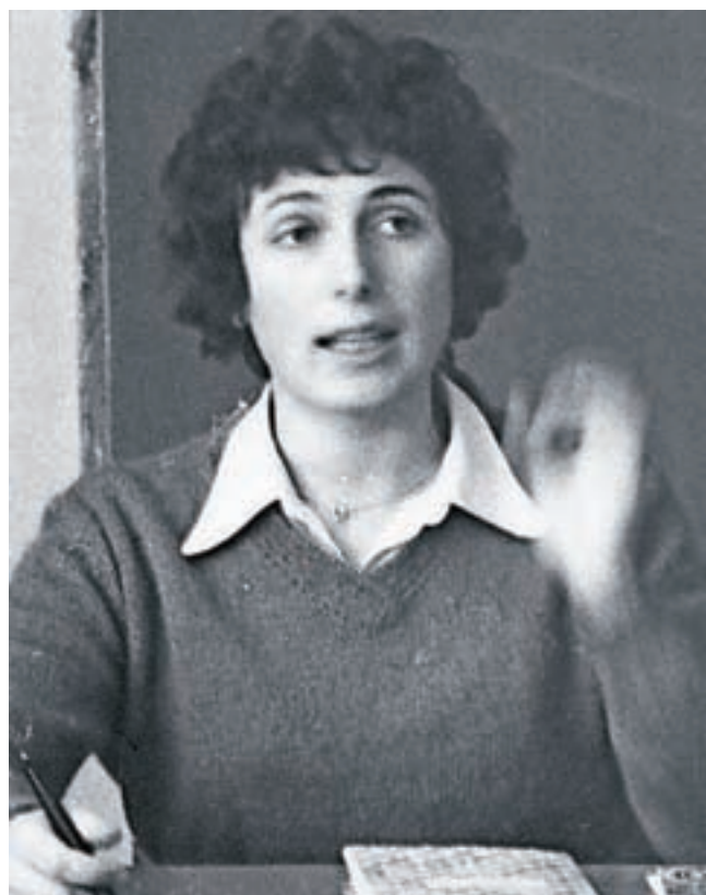
Mija v prvem letu poučevanja

V dopoldanskem času bom lahko občudovala prelepo Jezersko dolino tudi jeseni, pozimi in spomladi in si privoščila kakšno "kofetkanje". Šla sem že v gozd po gobe in uživala, ko so se jutranji žarki odbijali od živo zelenega mahu. V miru lahko skuham kosilo. Vsa leta sem iz šole nosila kosila, saj je moka kuhati kosilo po tretji uri popoldne, čeprav rada kuham. Več časa bo za vrt – bo bolj pravočasno oplet. Z rekreacijo bom morala poskrbeti za telesno zdravje in z dobrimi knjigami za duhovno. In kadar ne bom vedela, kaj početi, bom pletla, vezla, filcala ... In seveda varovala vnučke, če bo treba.